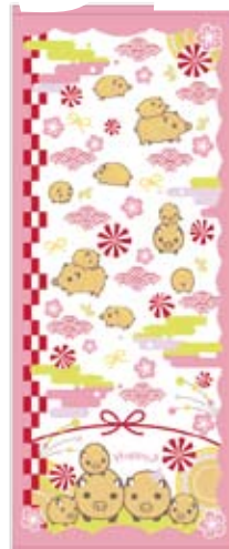
F4 なかよし 200 匁 / 3色色込のみ 175円