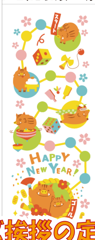
H2 すごろく亥 200 匁