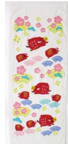
y3 いのしし親子 200 匁 170円