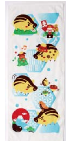
y1 うりぼう日和 200 匁 170円