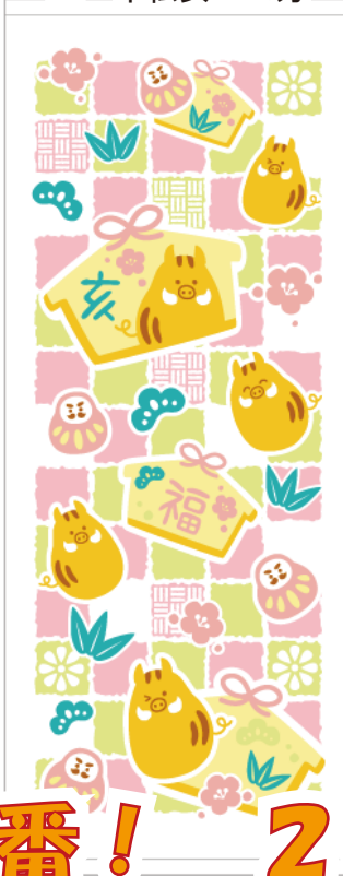
H3 市松亥 200 匁