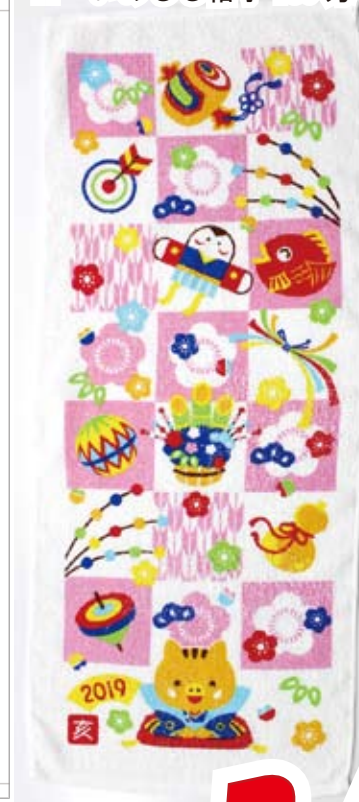
i1 いのしし格子 180 匁