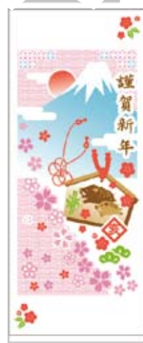
F3 謹賀新年 200 匁 平地付き 185円