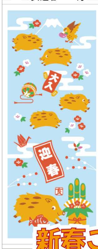
H1 亥迎春 200 匁