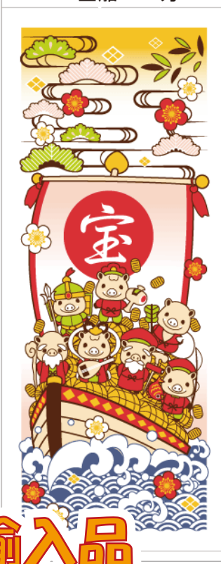
F2 宝船 180 匁