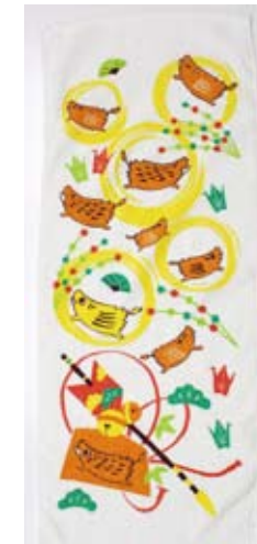
y2 破魔矢 200 匁 170円