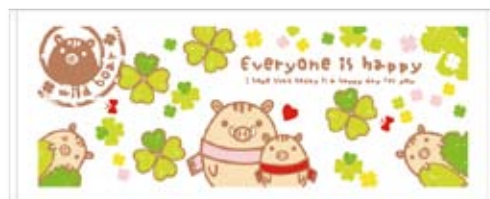
F5 クローバー 200 匁 170円